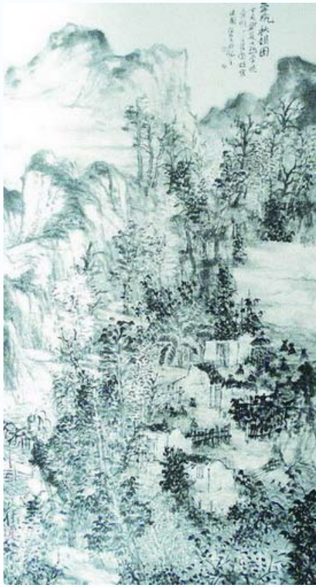
壶瓶秋韵图田绍登作