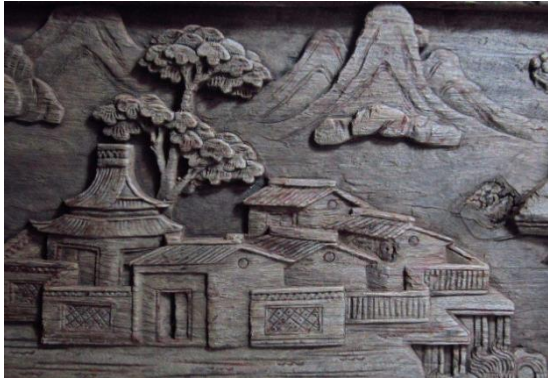
《潇湘八景》其中三幅

桃源木雕的这四个类别的雕刻，亦或起了点缀作用，亦或起了供奉信仰的作用，但不管是起了那种作用，都体现了人们对生活的向往与追求。整体的来说，桃源木雕海纳百川，还创新了独特的艺术风格，既有吸收消化后创新，又有在本身的基础上的创新，更有原有的传统文化上的创新。从起源到兴起，再到鼎盛、衰落。走过了世世代代，但是都保留了一件东西，那就是中华民族的魄力和精华，更是体现了本土的文化底蕴和传统风格。它们将自己的魅力一一的向人们展示着，也展示着它们的悠悠历史。